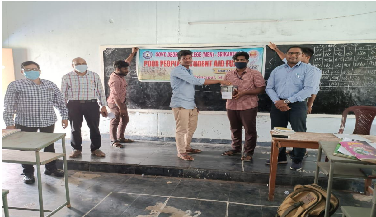
Collecting funds in the college by Share and Care Committee