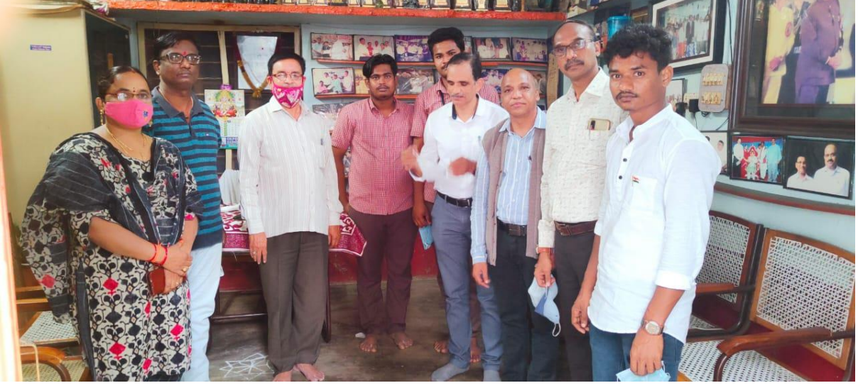
Donation of Rice bags and Oil to Behara Manovikasa Kendram paper clippings