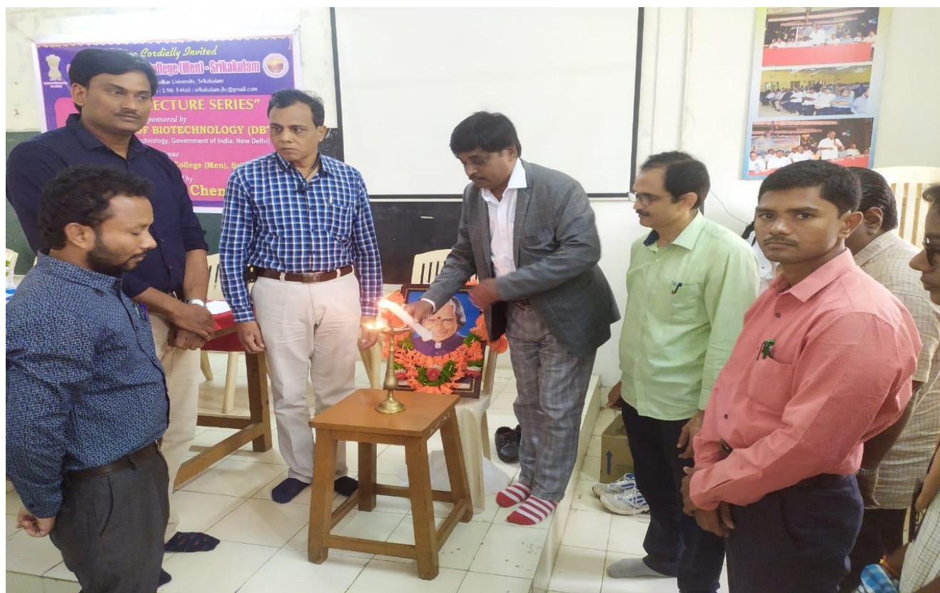
Lighting of lamp