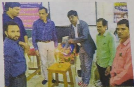
జ్యోతి ప్రజ్వలన చేసి కార్యక్రమాన్ని ప్రారంభిస్తున్న వక్తలు, ప్రిన్సిపల్