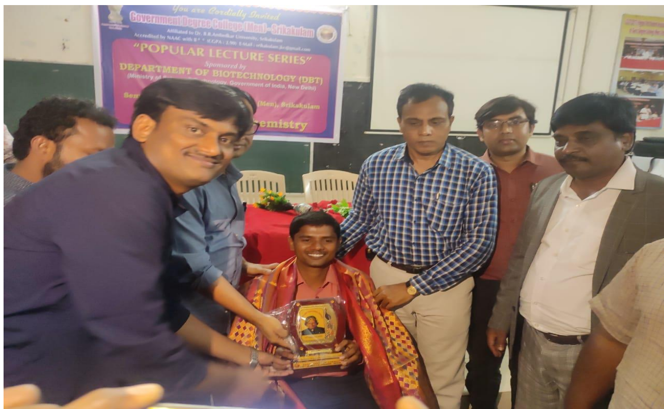
Felicitaton to Resource Persons